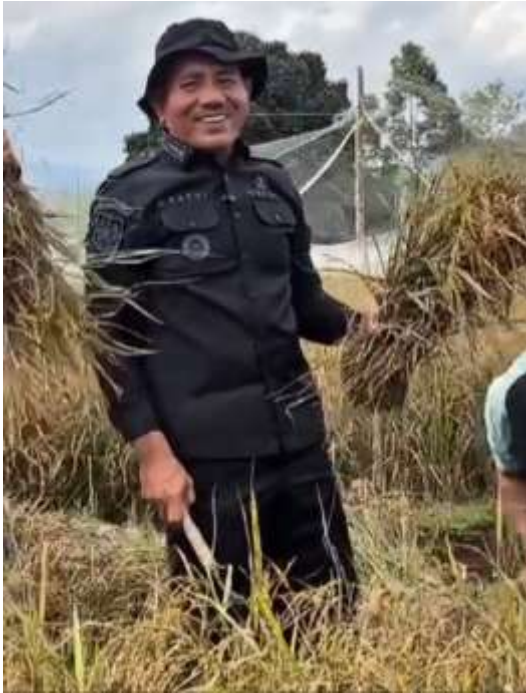
Bupati Lima Puluh Kota bersama masyarakat melakukan Panen di Sawah Harapan